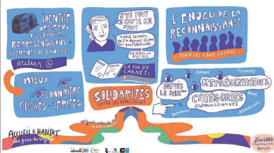
2 extraits d'une fresque réalisée par Céline Ziwès, illustratrice et facilitatrice graphique